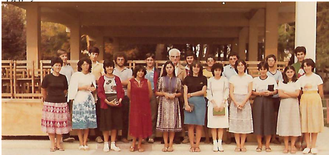
Ομαδάρχες- ομαδάρχισσες, μετά την πρωινή συμπροσευχή στη Λεπτοκαρυά

Στην κατασκήνωσή μας στη Λεπτοκαρυά ως ζευγάρι υπηρετήσαμε για πολλά χρόνια από διάφορες θέσεις, ομαδάρχες και - κάτι που απέφευγα - μια χρονιά αρχηγός