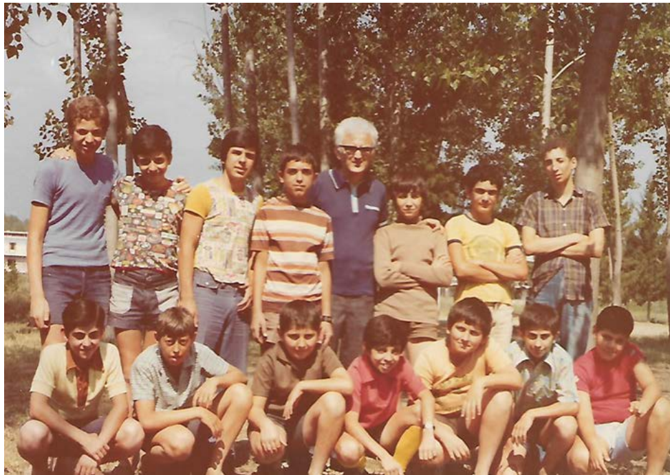
Μια ομάδα αγοριών στην κατασκήνωση Λεπτοκαρυάς. Σήμερα, όλα τα παιδιά είναι παντρεμένα. Κάποιοι είναι και παπούδες!

Στην κατασκήνωσή μας στη Λεπτοκαρυά ως ζευγάρι υπηρετήσαμε για πολλά χρόνια από διάφορες θέσεις, ομαδάρχες και - κάτι που απέφευγα - μια χρονιά αρχηγός