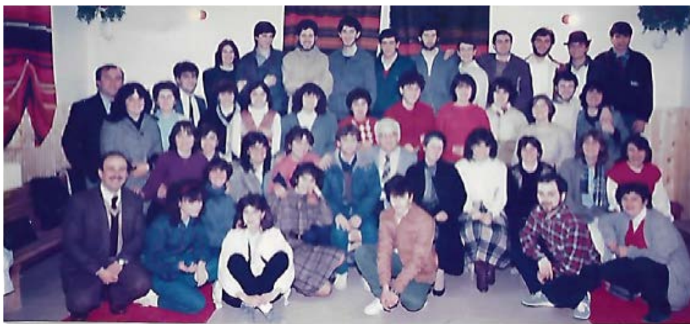
Αποχαιρετιστήρια εκδήλωση από τον Όμιλο Νεολαίας για την 25ετή διακονία μου στη Νεολαία μας.