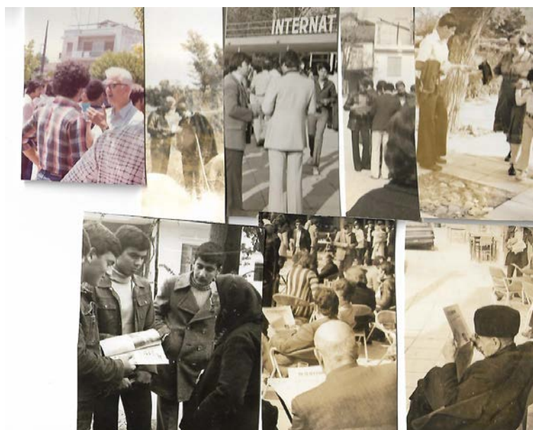
Ομάδα διανομής εντύπων στη Διεθνή Έκθεση Θεσσαλονίκη και σε άλλες πόλεις.