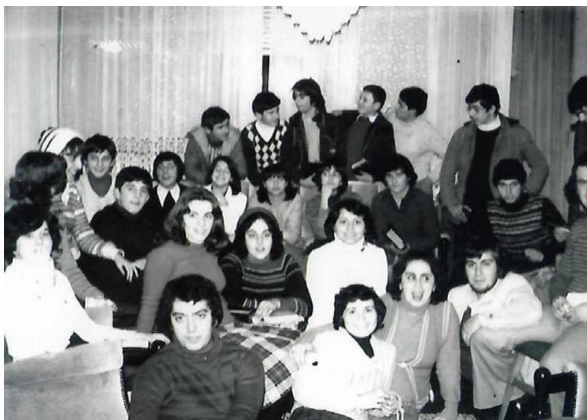
Συνάθροιση Νεολαίας σε σπίτι