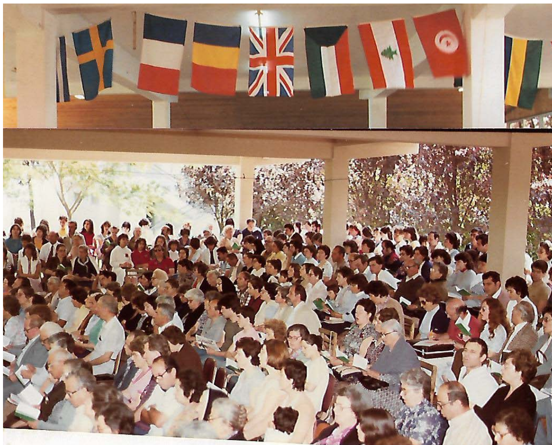
Ένα από τα πρώτα ιεραποστολικά συνέδρια