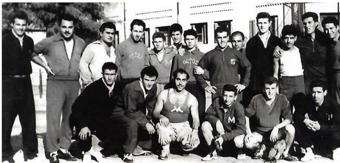
Οι αθλητές του στίβου του ΜΑΚΕΔΟΝΙΚΟΥ Θεσσαλονίκης