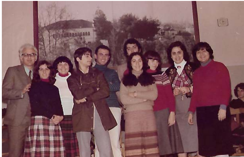
Τα πρόσωπα που βραβεύτηκαν σε Βιβλικό Διαγωνισμό στον Όμιλο Νεολαίας