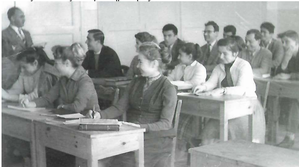
Ώρα διδασκαλίας στο ΒΙΚ.