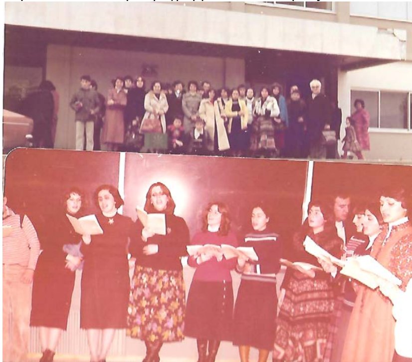
ΕΠΑΝΩ: Το συγκρότημα στην Είσοδο της Κλινικής «Άγιος Λουκάς» ΚΑΤΩ: Πρόγραμμα στους ασθενείς.