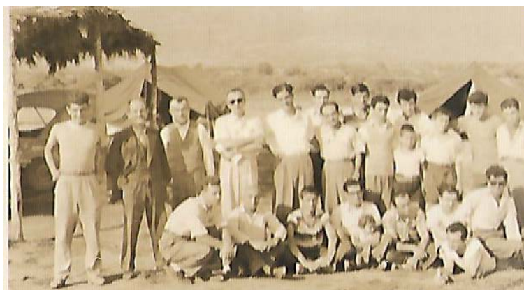
Στην Κατασκήνωση Λεπτοκαρυάς στα πρώτα χρόνια