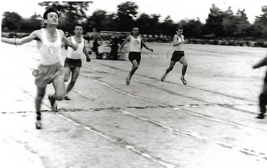
Για πρώτη φορά στους Παμπιερικούς αγώνες στα 100 μέτρα

Από τη δεύτερη τάξη του Γυμνασίου ως το τέλος φοίτησα στα ΕΚΠΑΙΔΕΥΤΗΡΙΑ ΠΑΠΑΔΗΜΗΤΡΙΟΥ . Ήταν για μένα «καταφύγιο» για να περνάω τις τάξεις, χωρίς να διαβάζω! Ήδη έκανα αναφορά στην περίοδο αυτή. Είχα κλήση στον αθλητισμό. Στην ομάδα του βόλεϊ μπολ του σχολείου μας είχα καθιερωθεί μόνιμα στη θέση του «κατεβαδόρου» (καρφιού). Αν και ο αριθμός των μαθητών στο σχολείο μας ήταν μικρός, νικούσαμε ομάδες στρατού και κάποτε ακόμη και του Δημόσιου Γυμνασίου. Έπαιζα και μπάσκετ μπολ. Όταν ήμουν 17 ετών προκηρύχτηκαν οι «Παμπιερικοί» αθλητικοί αγώνες στίβου. Χωρίς να ξέρω τι σημαίνουν αυτοί οι αγώνες, πήρα μέρος εκ μέρους του σχολείου μου σ' αυτούς. Στο αγώνισμα των 100 μ. ήταν φαβορί ο έμπειρος αθλητής του Ηρακλή Θεσσαλονίκης Θεόφιλος Καμπερίδης , που διετέλεσε βουλευτής και Δήμαρχος Κατερίνης. Χωρίς καμία προπόνηση και με πάνινα παπούτσια, βγήκα άνετα πρώτος, νικώντας και τον Καμπερίδη. Επίσης βγήκα πρώτος και στο άλμα εις ύψος και δεύτερος στο απλούν.