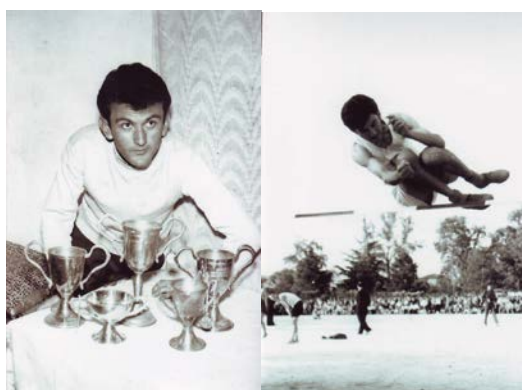
Για πρώτη φορά στους Παμπιερικούς αγώνες. Άλμα εις ύψος