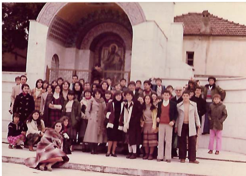
Εκδρομή Ομίλου Νεολαίας στο Βήμα του Αποστόλου Παύλου στη Βέροια.