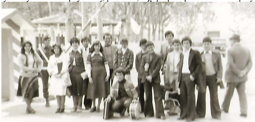
Το Μουσικό Συγκρότημα στην Πύλη του Στρατοπέδου, μετά από πρόγραμμα που έδωσε ένα Πάσχα.