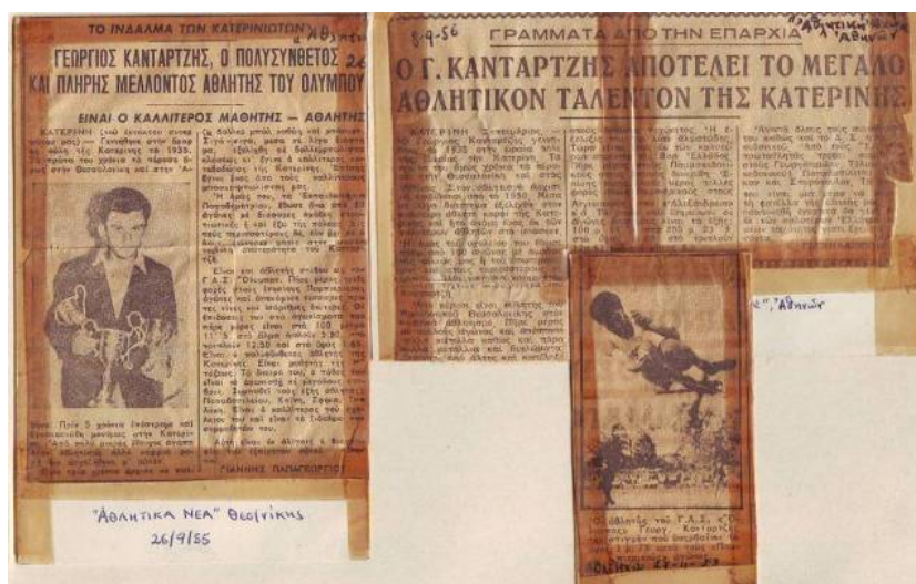
Αριστερά από την εφημερίδα ΑΘΛΗΤΙΚΑ ΝΕΑ (Θεσσαλονίκης). Δεξιά από την εφημερίδα ΑΘΛΗΤΙΚΗ ΗΧΩ Αθηνών.