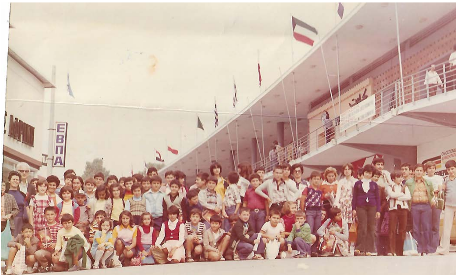
Τα παιδιά του Θερινού Σχολείου της ΕΕΕ Κατερίνης. Επίσκεψη στη Διεθνή Έκθεση Θεσσαλονίκης.

Μου είχαν αναθέσει την ευθύνη διοργάνωσης των Θ.Σ. Τους θερινούς μήνες είχαμε μαθήματα σε εκκλησίες της Β.Ε. Τα έξοδα κάλυπτε μια οργάνωση Θ.Σ. των ΗΠΑ. Το Θ.Σ. στην Κατερίνη προσέλκυε πολλά παιδιά όχι μόνο της εκκλησίας μας, άλλα και παιδιά της περιοχής μας. Και το Θ.Σ. στην εκκλησία Σεβαστής και στην Καρδιτσομαγούλα συγκέντρωνε πολλά παιδιά, που παρακολουθούσαν τα προγράμματά μας. Τα περισσότερα παιδιά ήταν από Ορθόδοξες οικογένειες. Μείναμε