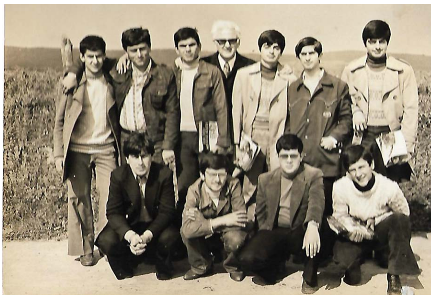
Μια ομάδα διανομής εντύπων