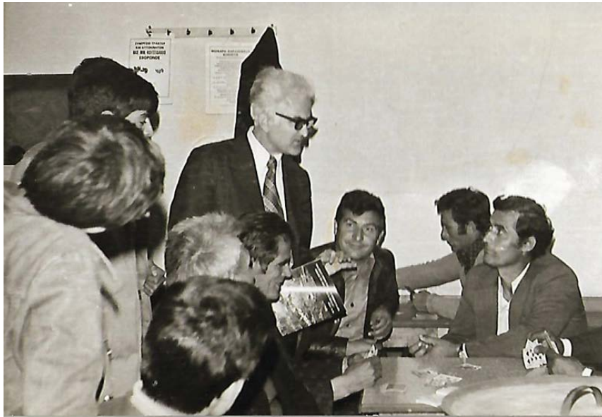
Συζήτηση σε καφενείο μετά τη διανομή εντύπων σε χωριό της Κατερίνης