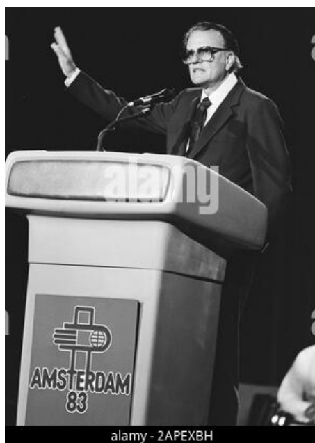
Ο Μπίλ Γκράχαμ, διοργανωτής του Συνεδρίου